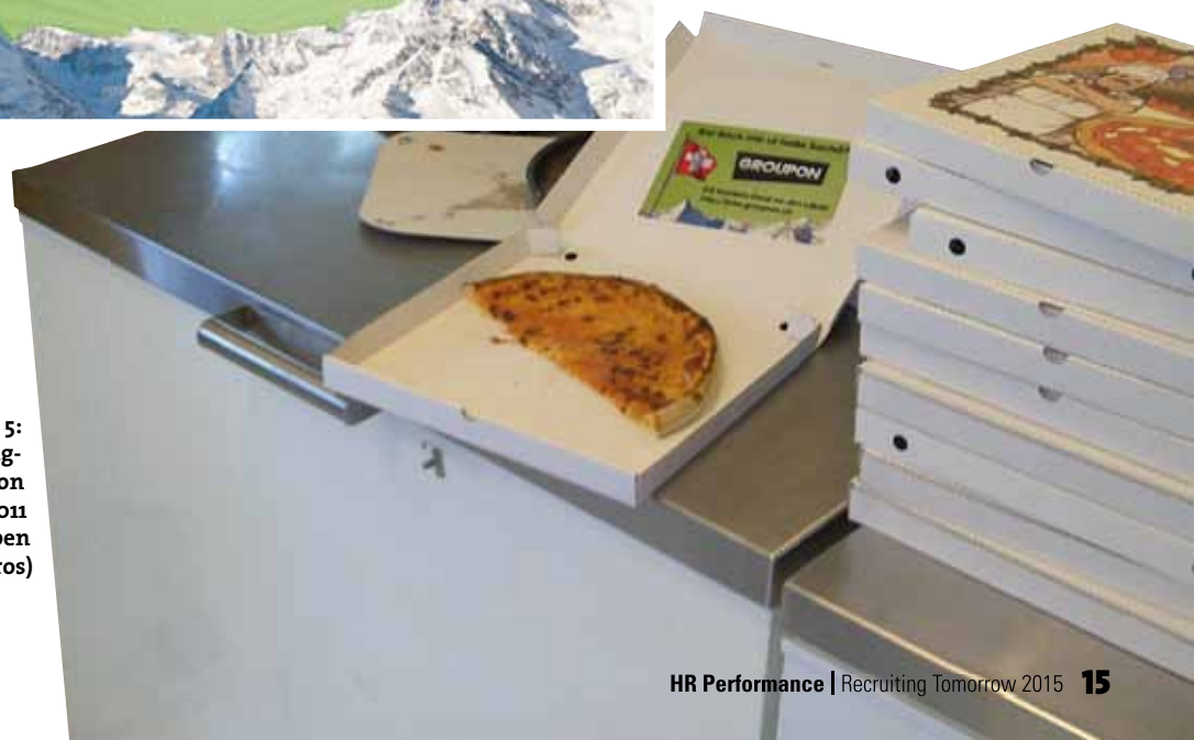
Abbildung 5: Guerilla-Recruiting-Aktion der Groupon GmbH aus dem Jahr 2011 (Lieferung von halben Pizzen in Vertriebsbüros)