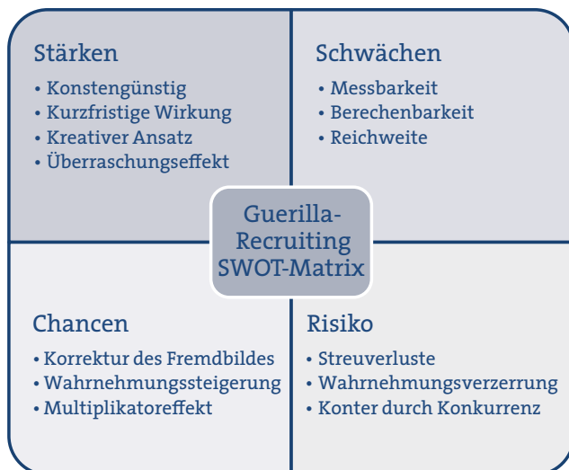
Abbildung 7: Guerilla-Recruiting SWOT-Matrix

Guerilla-Recruiting kann für jedes Unternehmen eine Chance darstellen, da der Maßnahmenkatalog eine ausreichende Bandbreite liefert. Solange die Risiken umfassend eingeschätzt werden und ein authentischer Auftritt gewahrt wird, kann das Guerilla-Recruiting den klassischen Marketing-Mix attraktiv erweitern, um Arbeitgebermarken dynamischer darzustellen, mit geringem Budgeteinsatz große Wirkungen zu erzielen und neue Talente für das Unternehmen zu gewinnen. ◀