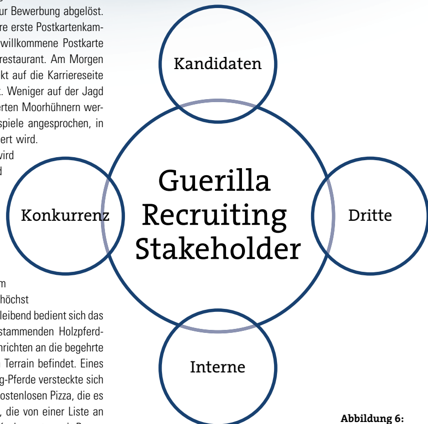
Abbildung 6: Stakeholder des Guerilla-Recruitings

Diese Segmentierung zeigt: Ob kostengünstiger Fahrradsattelüberzieher, kreative Pizza oder Organisation einer Veranstaltung – das Guerilla-Recruiting ist variantenreich und flexibel. Ein minimaler Mitteleinsatz, der