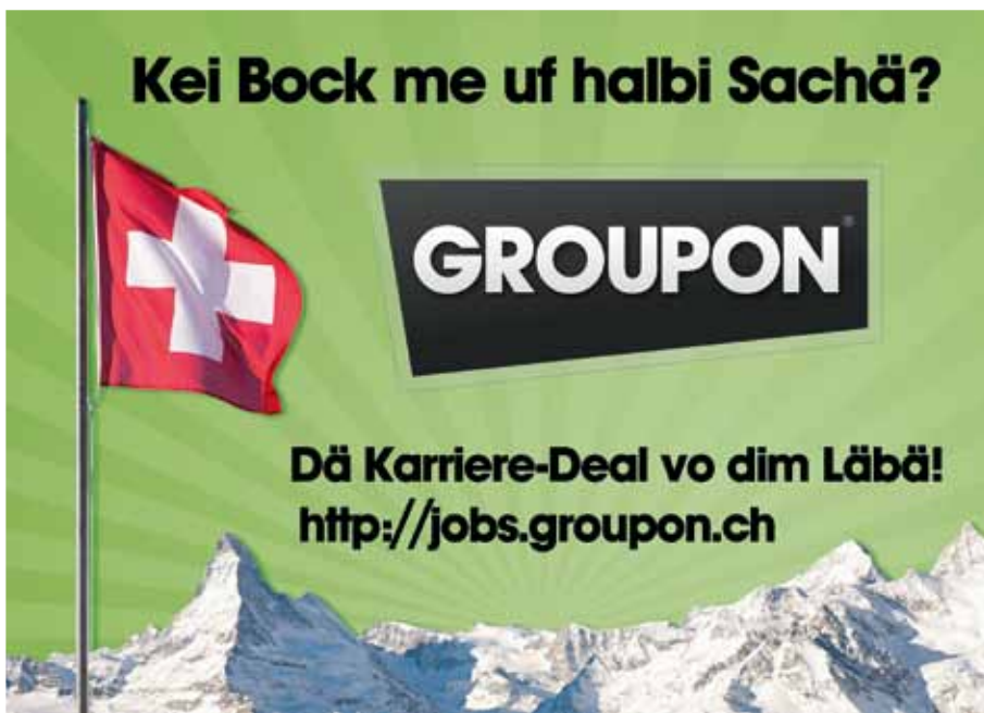
Abbildung 4: Guerilla-Recruiting-Sticker der Groupon GmbH aus dem Jahr 2011