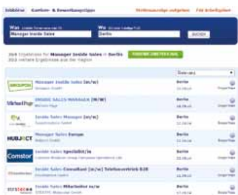
Abbildung 2: Screenshot Stepstone.de, Suche nach „Manager Inside Sales“ & „Berlin“ (23. September 2014)